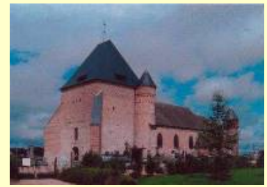
© Mairie de Flavigny-le-Grand et Beaurain